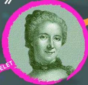
EMILIE DU CHATELET

Centre de Meuse/Haute-Marne, RD 960 55 290 Bure