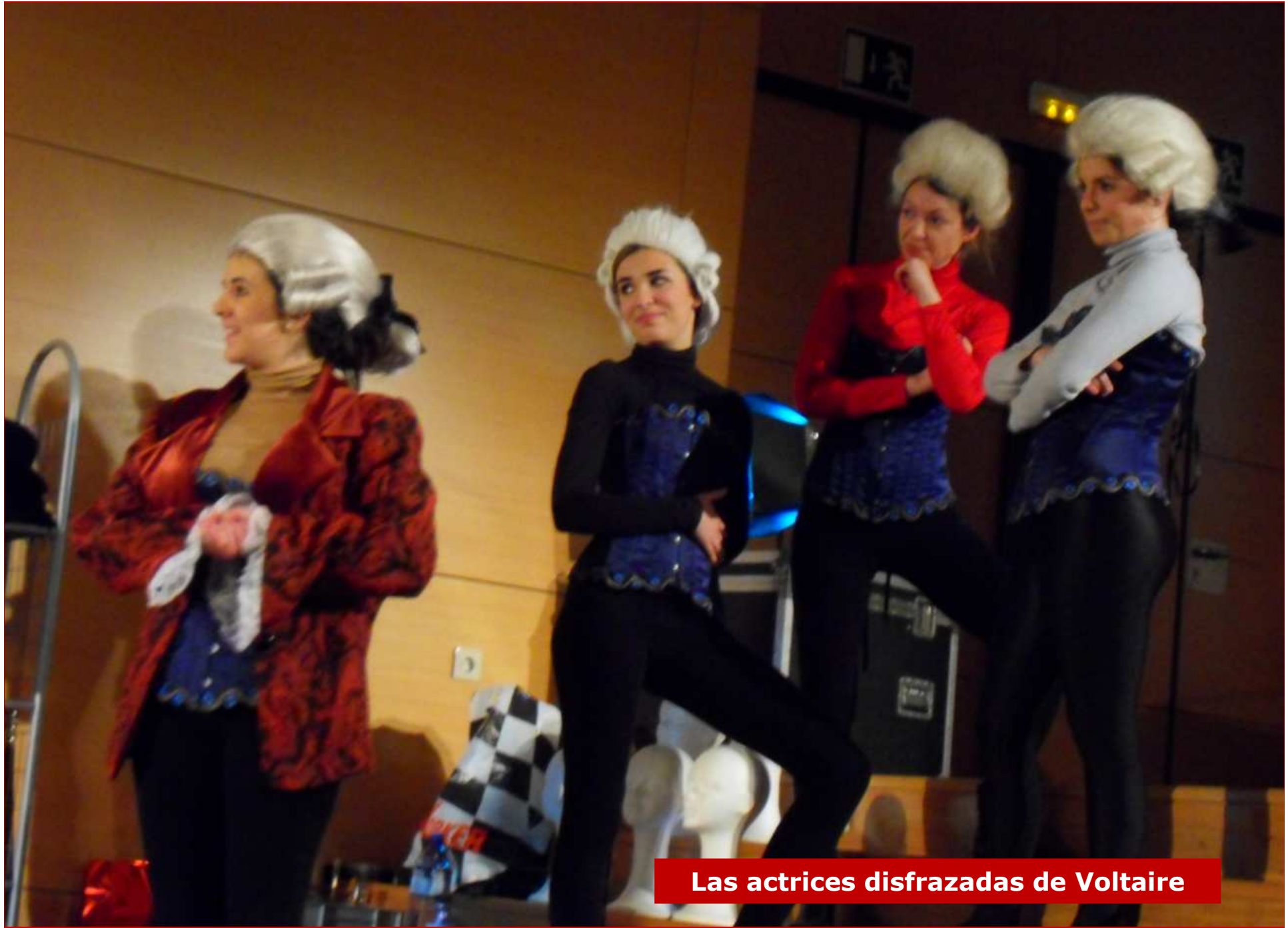
Las actrices disfrazadas de Voltaire