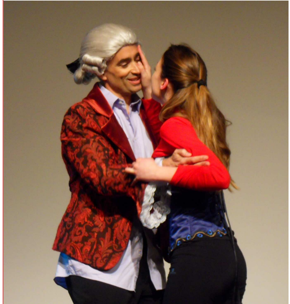
Voltaire (Miguel) y Émilie (Amaia)

En pleno siglo de las luces, la Ilustración combatía la ignorancia, la superstición y la tiranía, con el propósito de construir un nuevo mundo asentado en el conocimiento, en el progreso y la igualdad. Pero, pese a que en ese combate muchas mujeres tuvieron un papel relevante, las sociedades ilustradas negaban su presencia y participación. Émilie de Breteuil , marquesa de Châtelet, aristócrata y científica, dedicó buena parte de su vida a la traducción y divulgación de las teorías de Newton, pero le fue prohibido el acceso a los círculos científicos dominados por los hombres. Para combatir la marginación, Châtelet no duda en jugar a la simulación, a la confusión carnavalesca, al intercambio de máscaras y de apariencias. Teatro dentro del teatro, un juego de espejos realizado a través de los juegos del lenguaje, del poder de la palabra y de la poesía, para hacer y dar a conocer la ciencia. ( Eneko Lorente )