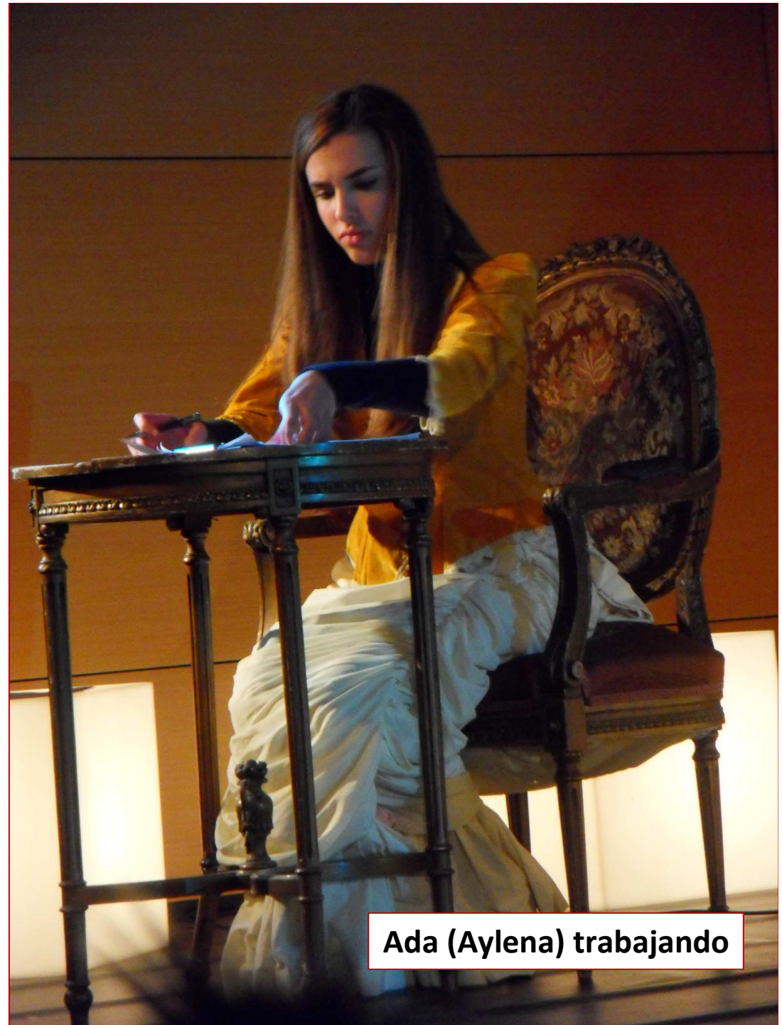
Ada (Aylena) trabajando

Ada, diseñadora del primer lenguaje de programación con el que trata de insuflar vida a la Máquina Analítica, un ingenio ideado por el científico de la computación Charles Babbage, sostiene una viva polémica con éste por la autoría y el reconocimiento del talento puesto al servicio de la realización de las ideas de su promotor. ( Eneko Lorente )