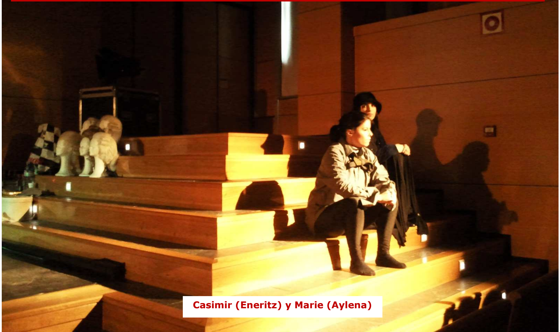
Casimir (Eneritz) y Marie (Aylena)

Marie Curie , biografía forjada contra la adversidad. Inmigrante. En su país natal el acceso de la mujer a la formación superior y al campo científico era todavía impracticable, en el umbral del siglo XX. Pese a su innegable contribución al descubrimiento de la radiactividad y tras el logro de dos premios Nobel, el reconocimiento de su trabajo de investigación continuó siendo objeto de sospecha, de crítica y maledicencia. (Eneko Lorente)