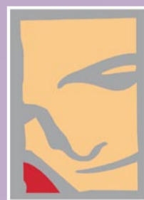
Hazkunde S. L.