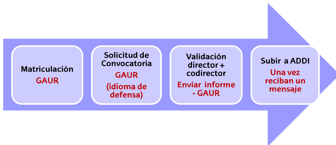
Figura 1. Esquema secuencial del proceso de matriculación y entrega de la memoria.

El tribunal evaluador de los TFG recibirá el TFG del alumnado a través de la plataforma ADDI.