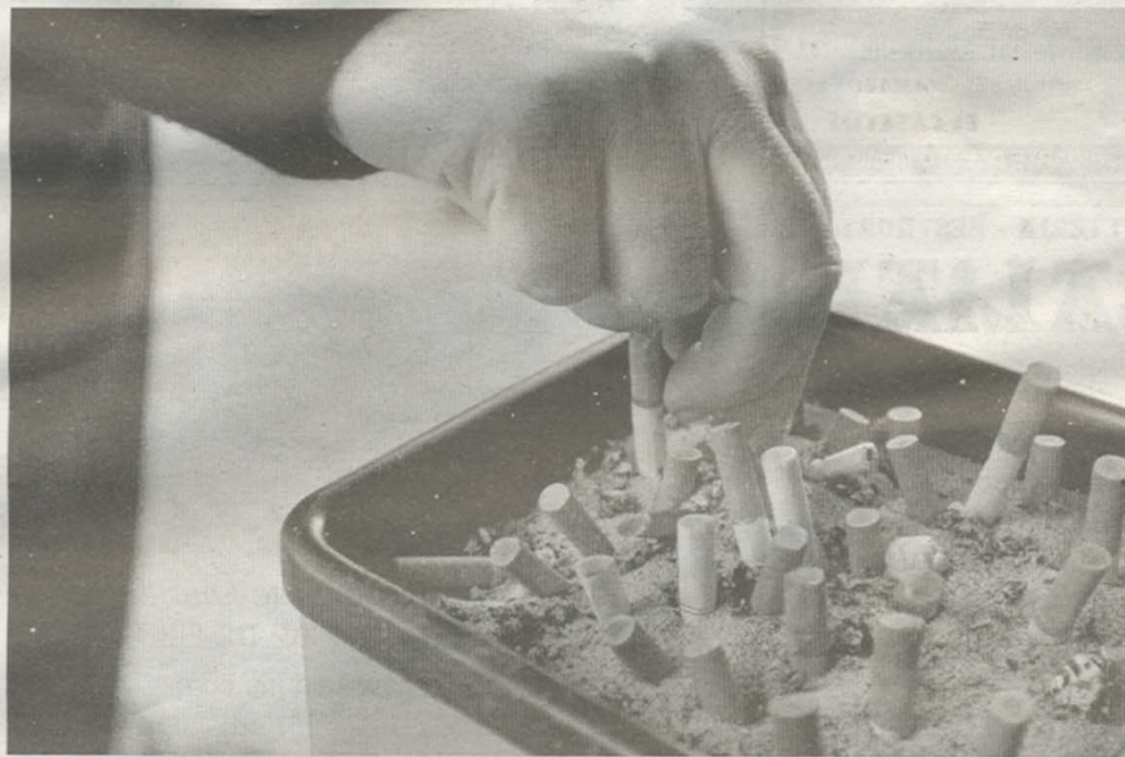
Un hombre apaga su cigarrillo en el cenicero de una papelería.

En el Estado español, se han fumado desde desde la entrada