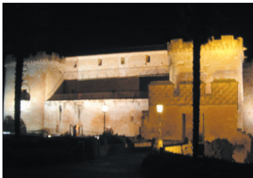
Muchas personas aseguran haber visto un espectro blanco. Alberto de Pablo.

El castillo es ahora un hotel lujoso y carismático. En su interior hay salones con grandiosas chimeneas amparadas por relieves y techos de madera, pasillos que parecen laberintos embrujados por la magia de sus espacios de penumbras, escondiendo sus secretos, con cuadros que te clavan su mirada. Las estancias son acogedoras y misteriosas, el interior del castillo es gótico y renacentista.