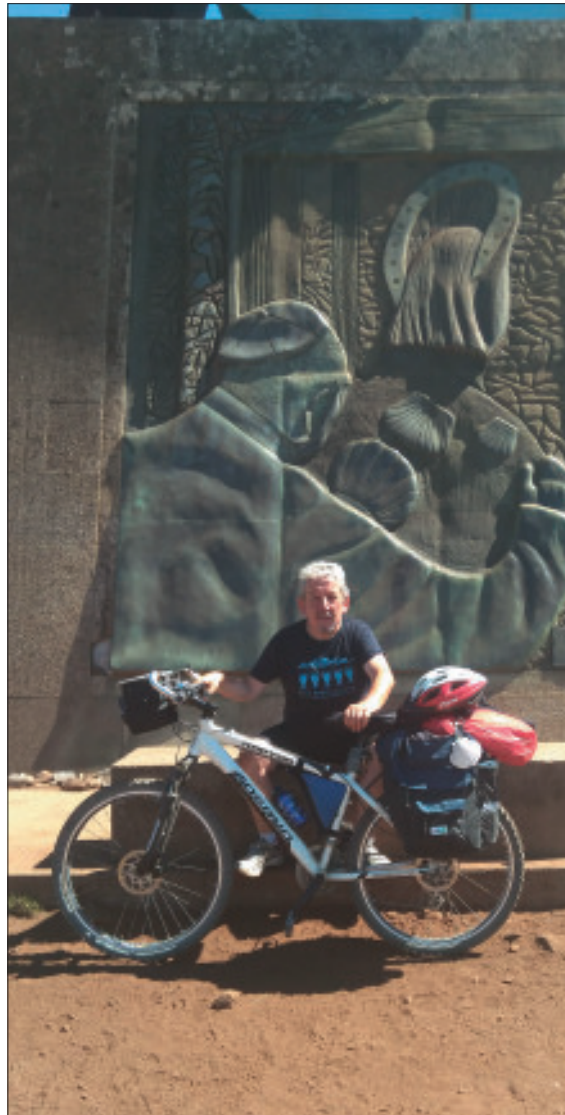
Monte do Gozo, ya muy cerca de Santiago. Aitor V.

La creación del juego se le atribuye a los Caballeros Templarios, aunque existe una hipótesis que asegura que el juego de la Oca fue inventado por el ejército griego durante el asedio de Troya basándose en el «Disco de Phaistos».