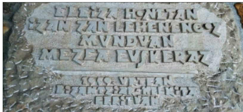
Oroipen-plaka Arrazolako elizan.

Arrazolako San Migel parrokian eman zen euskarazko lehen meza, 1959ko ekainaren 21ean , eliza katolikoak herri hizkuntzak erabiltzeko baimena eman baino sei urte lehenago.