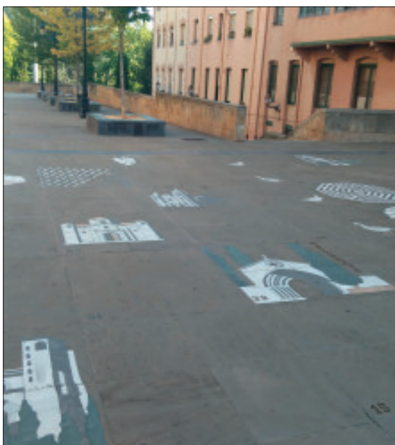
Juego de la Oca, en la plaza de Santiago en Logroño. V.V.

Como dato, comentar que la Catedral de Santiago tiene 63 vidrieras y 63 columnas, 9 bóvedas, 9 coros y 9 torres. En el Pórtico de la Gloria se representa a Jesús rodeado de los cuatro evangelistas, San Juan aparece con una oca en la mano. La oca es un animal de profundo simbolismo, es volador, es terrestre y es acuático, domina los tres elementos. Nueve fueron también los fundadores de la Orden del Temple. Las casillas de las ocas están distribuidas cada 5 y 4 casillas,