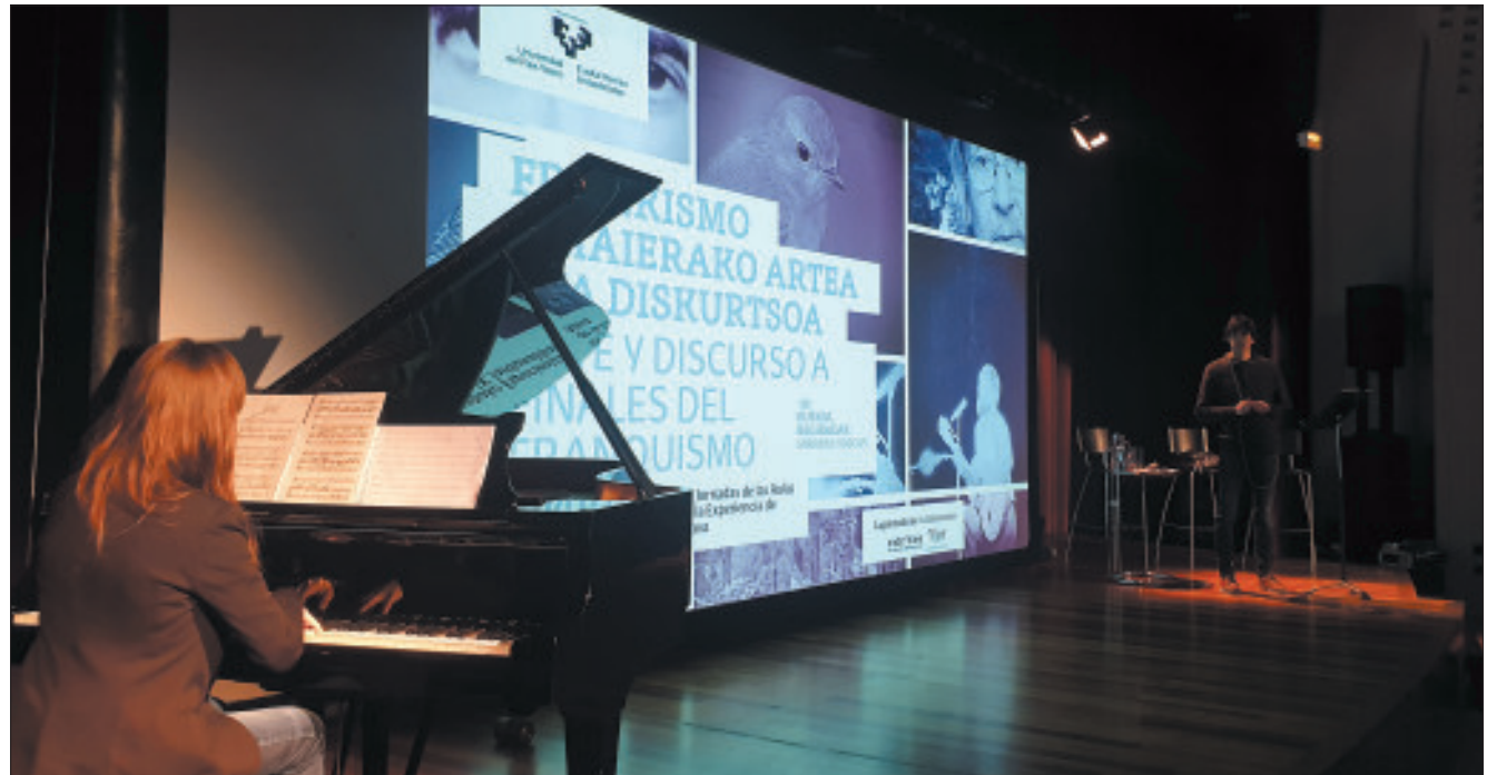
Concierto-Narración Txori Kantzale: tras los pasos de Xabier Lete, de las Jornadas de las Aulas.

Como ya es habitual, el elenco de actrices y actores del Grupo de Teatro de ACAEXA-AEIKE y de las Au-