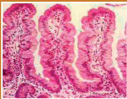
Biopsia en persona celíaca sana