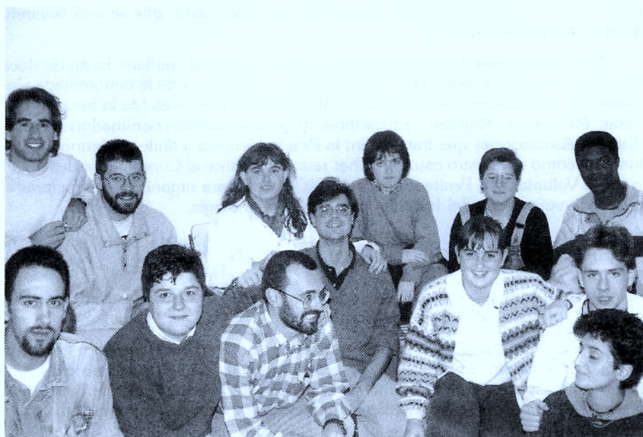
Grupo de voluntarios del IVAC-KREI, internos y educadores de II.PP.

El día 21 de junio se celebró en el Centro Penitenciario de Martutene el día de la música, acudiendo para la ocasión una serie de grupos y solistas. La Sección de Voluntariado del IVAC-KREI tomó parte en esa celebración, gestionando la actuación en dicho Centro de la Tuna de Derecho de San Sebastián (de la que forman parte algunos voluntarios del IVAC), que tuvo gran aceptación entre los internos.