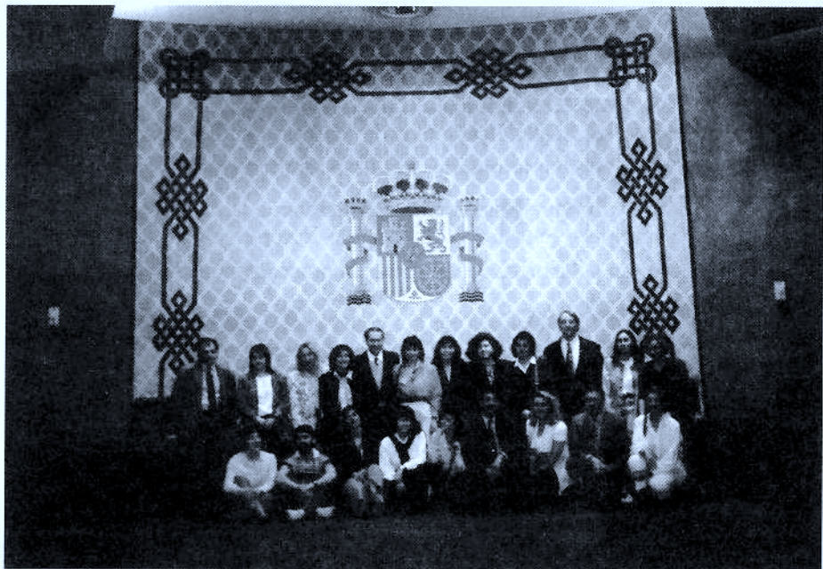
Grupo de estudiantes del Master Universitario en Criminología, en el Salón del Pleno del Tribunal Constitucional, en la visita que realizaron a este Tribunal y al Tribunal Supremo.

En cuanto a la actividad investigadora, en la Sección de investigación se detallan los trabajos de investigación realizados por los alumnos de 3.º Curso de Master Universitario, que se encuentran en la Biblioteca del IVAC-KREI a disposición de las personas interesadas en estas líneas de investigación.