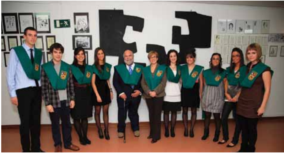
Alumnos becados junto con el Director y la Subdirectora