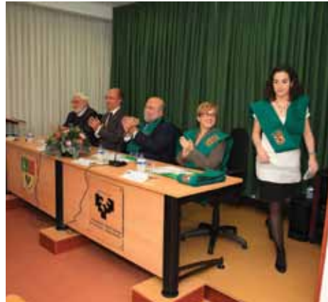
Mesa de autoridades