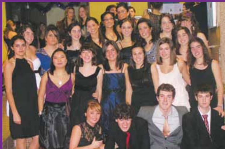
En el hall

Durante la fiesta se eligieron asimismo a los novatos del año y a los alumnos más populares y apreciados por sus compañeros.