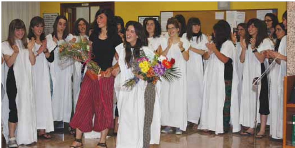
Actuación del coro en la Fiesta de Fin de curso