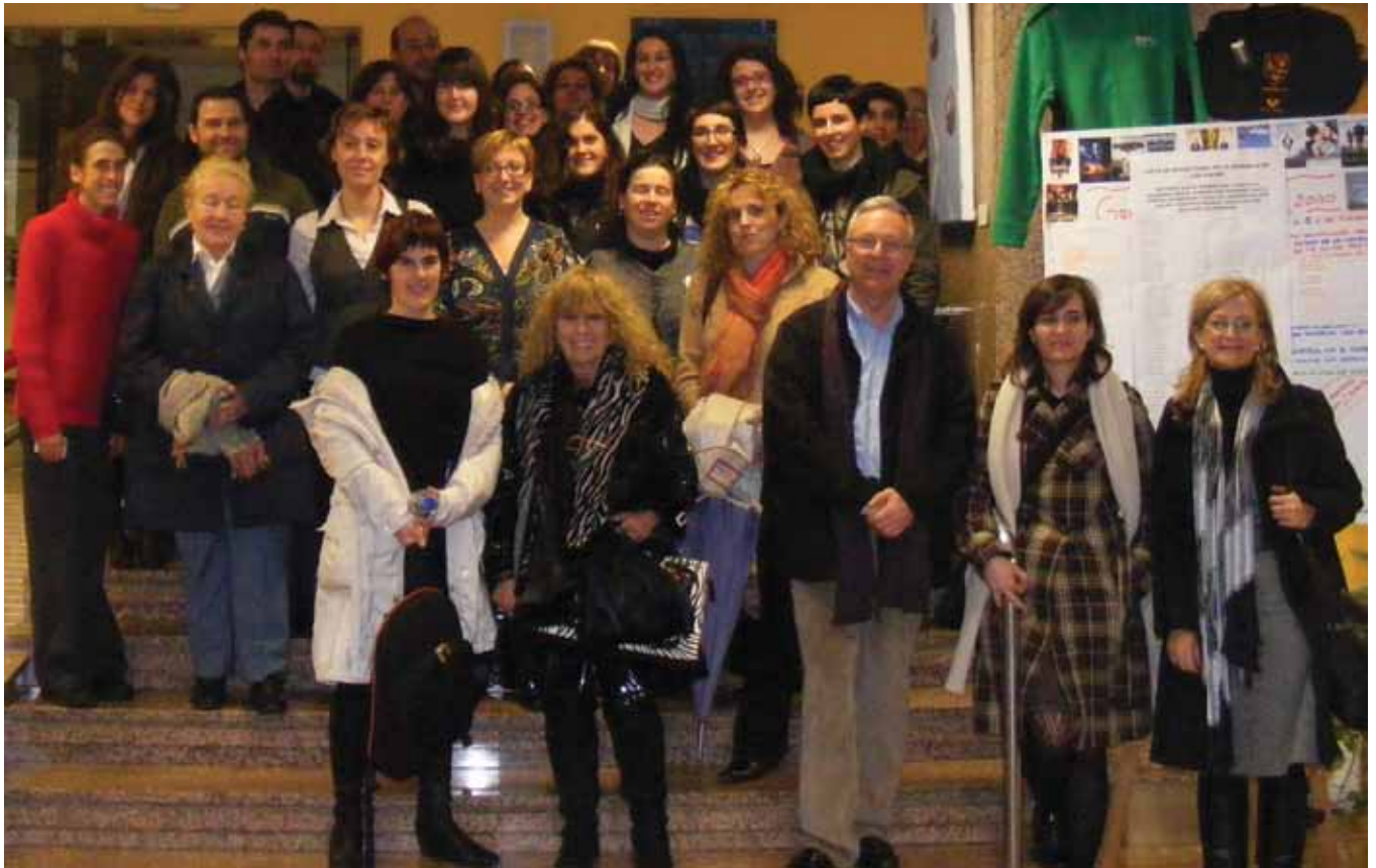
Congresistas en el Hall del Colegio