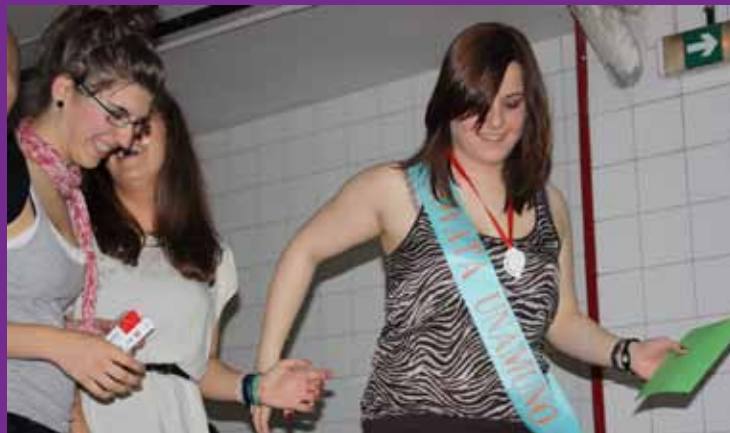
Novatos y Pascualines