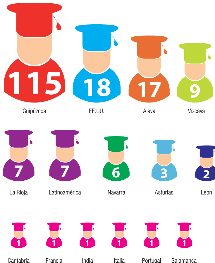
Figura 1. Procedencia de los colegiales

¡Vaya para todos ellos nuestra sincera y cariñosa felicitación!