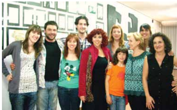
Equipo de cortometrajes

Mercedes Farriols (directora también del libro “Susurrar contra uno mismo” ) es directora de cine, actriz, escritora y educadora. Algunas de las Películas realizadas por Farriols: “Olga, Victoria Olga” (2007) Premio Especial del Jurado en India a la Mejor Película Extranjera y en Israel por Mejor Banda Sonora. 432UNO rodada en Argentina.