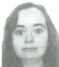
Tiradentes, Saenandoah Fundación Carolina Brasil