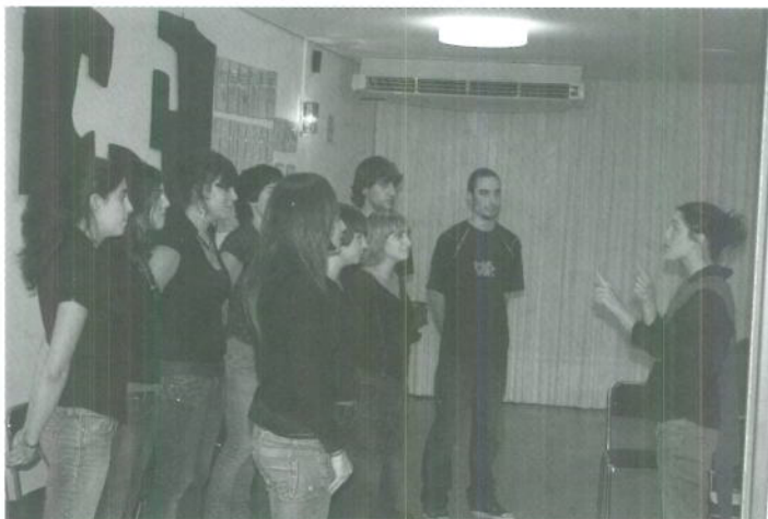
Actuación del coro durante la apertura oficial del curso

El Coro del Colegio (Coro Unamuno) merece un apartado especial en esta Memoria por su excelente hacer y calidad. El Coro contribuye a la formación musical de los colegiales, canalizando su interés por la música coral y entre sus objetivos está el buscar la diversidad en el repertorio: de la música religiosa a la popular, de la universal a la vasca, de la seria a la alegre, en un intento por conocer y disfrutar de un panorama musical amplio y enriquecedor.