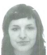
Ibarrondo Iñurrategi, Jone Publicidad y RR.PP. San Sebastián