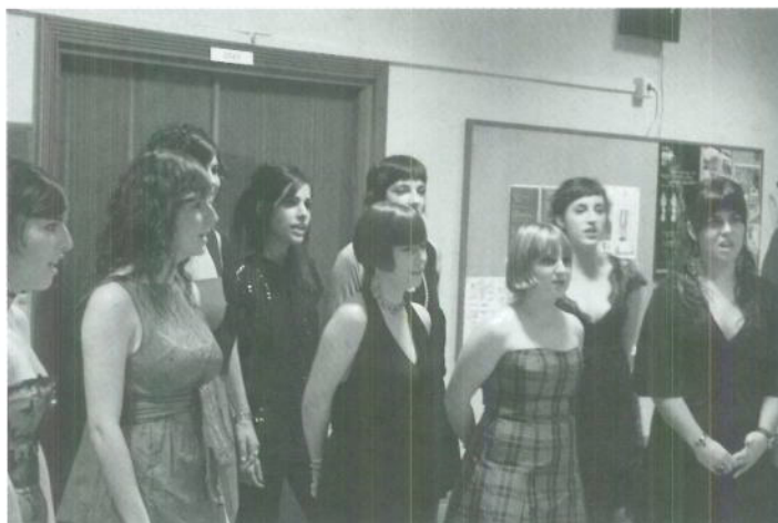
Las "chicas" del coro (Fiesta de Navidad)