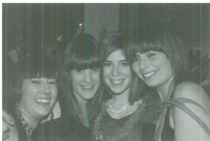
Ambiente durante la cena

a la mesa de la dirección (I. Salces), con lo que los gritos de ¡Tongo, Tongo! arreciaron este año más fuerte si cabe que el año anterior. Una colegiala y un vecino del barrio de S. Ignacio también obtuvieron una de las cestas. La fiesta continuó en el garaje, habilitado para la ocasión y, posteriormente, se extendió por otros lugares de la Villa.