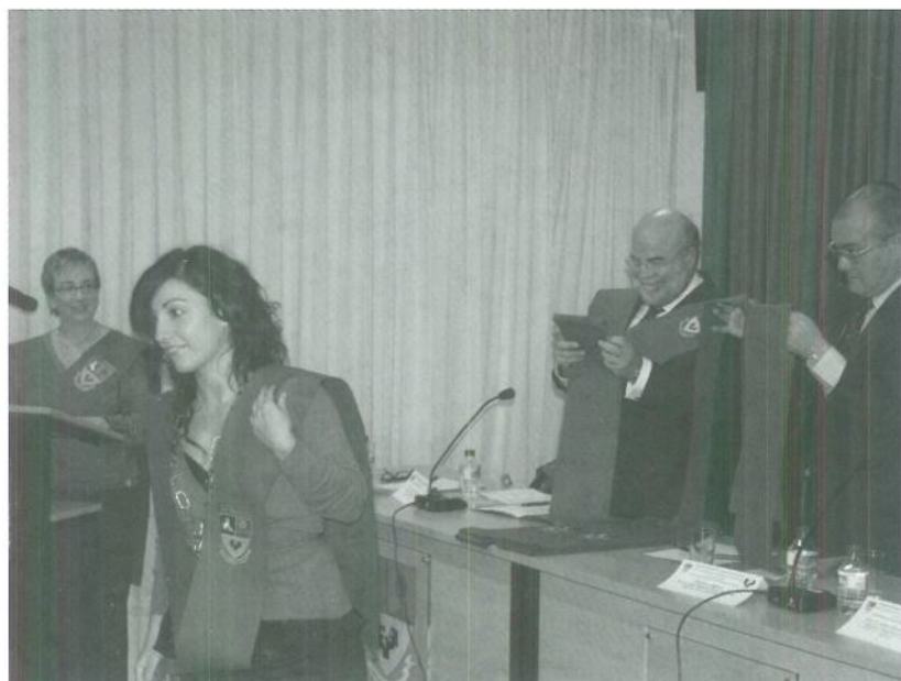
Imposición de becas.