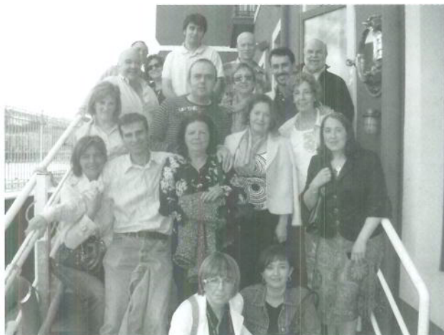
La "peña" casi al completo