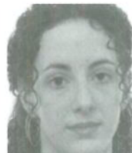
Ladrón de Guevara Antoñana, Leire Empresariales 2º / Ordoñana