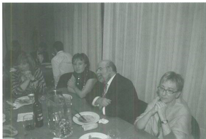
Mesa de invitados