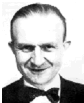
François Perroux (1903-1987)

La capacidad de integración de la nación no vela el conflicto social que la atraviesa. Sea cual sea la fuerza de integración que representan la realidad histórica de la nación, este conflicto social es de tal naturaleza que la integración nacional es impensable sin el Estado, "la fuerza concentrada y organizada de la sociedad" que señala Marx en El capital (I, XXXI), que "ejerce el monopolio de la represión suprema y legitimada" (F.Perroux, Pouvoir et Economie , Bordas 1973). El Estado va efectivamente a jugar su papel, diferente según los periodos, pero jamás prescindible, en estas relaciones entre las naciones.